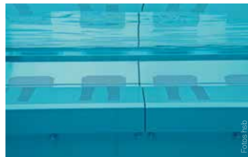
Die hsb-Whirliegen und die Massagedüsen sind ideal für Entspannungssuchende.