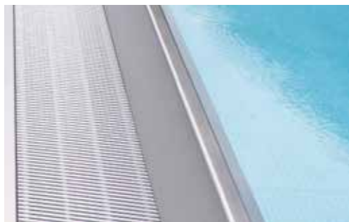
Durch die Infinity-Rinne erhält der Pool einen weitläufigen und eleganten Touch.

hsb group hsb austria gmbh · hsb germany gmbh · hsb switzerland inc · hsb france sas www.hsb.eu